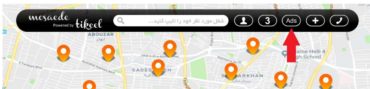
کلیک بر روی گزینه Ads